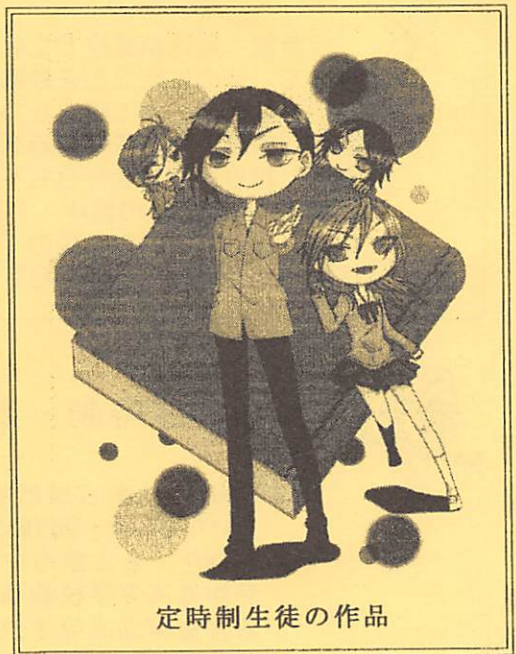
定時制生徒の作品